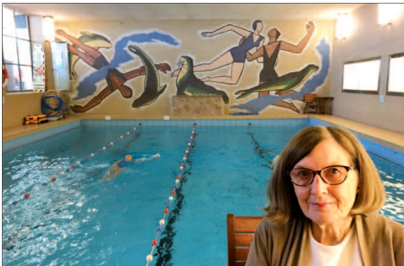
Fra Vestkantbadet, Kavringen nr. 91 (november 2018).