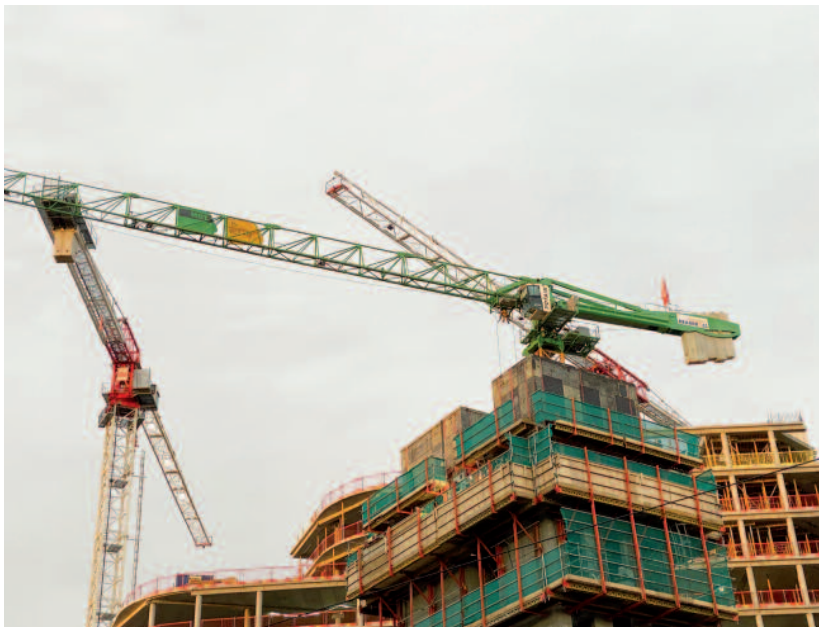
Kranballetten i Vika.

Den nye Ruseløkka skole er ett eksempel. Ifølge planen er levetiden for bygningen anslått til tretti år. Den erstatter en solid skole i stein og tegl som sto i 150 år, og som ifølge folk som har greie på det, fint kunne ha stått i minst 100 år til. Skolebygningen var en identitetsmarkør i strøket og et levende historisk monument.