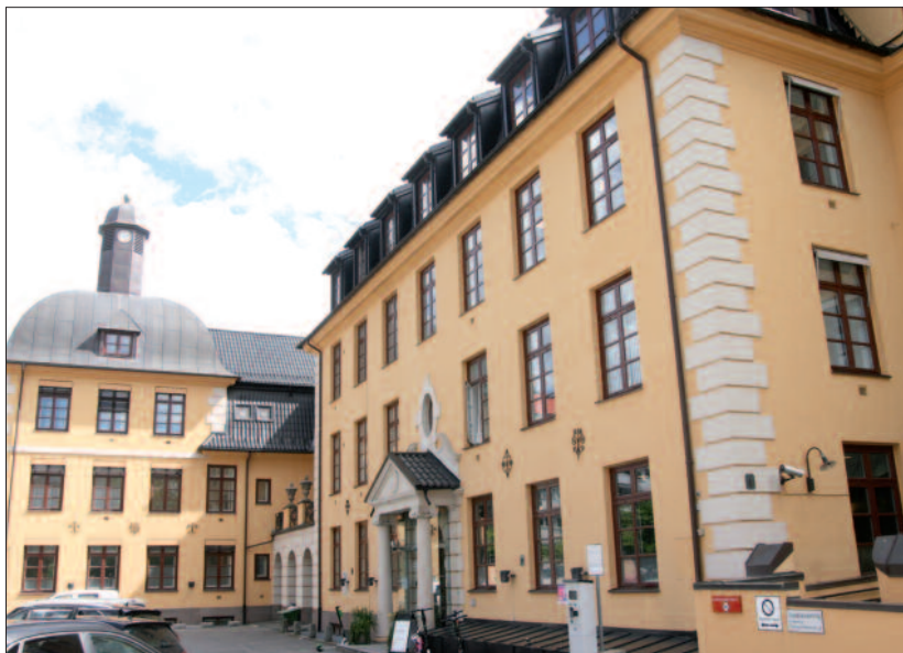
Røde Kors Klinikk, Frederik Stangs gate 11.