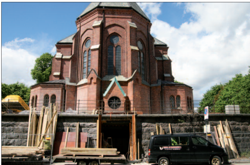
Ny inngang fra Skovveien til et nytt opplevelsesrom under alteret.