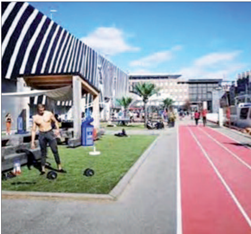
Temporære underholdningselementer er på plass på Filipstad.

Noen mener også at denne delen av Oslo faktisk ikke har så stort hastverk med en ferdigutvikling, i motsetning til Aker Brygge, Tjuvholmen og Bjørvika med Sørenga. Derfor har Oslo Havn allerede igangsatt publikumsrettete aktiviteter på Filipstad som skateboardramper, «13-parken», boulebane, Stein Erik Hagens kunstige og selvlysende kjempetre, og flere temporære underholdningselementer er under planlegging. Så mens vi beboere i området venter på den store utbyggingsboomen, kan vi egentlig ha det ganske hyggelig på deler av Filipstad!