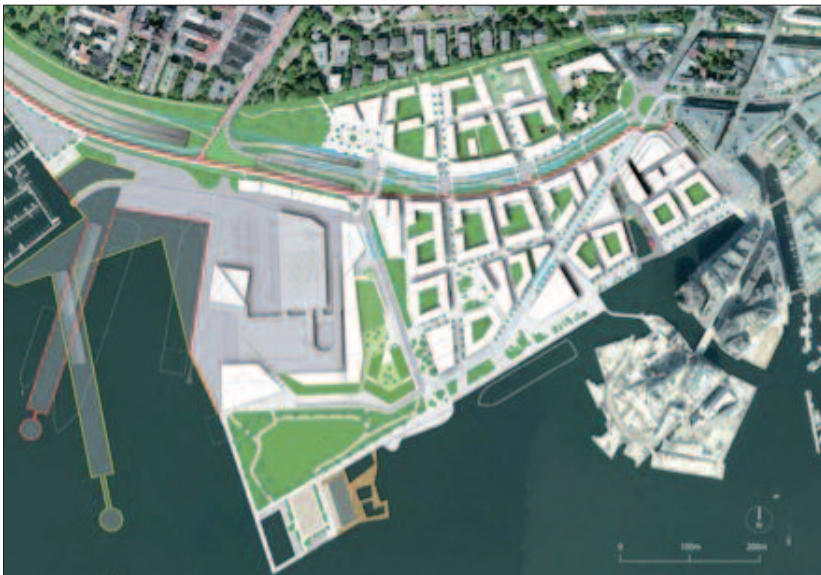
Plan- og bygningssetatens alternativ 1 for Filipstad.

Filipstad inngår i planene for havnepromenaden, vedtatt i 2008. I dag foreligger det flere utkast til hvordan Filipstad kan bli utviklet fra et rent havne- og fergeområde til en ny bydel. Utbyggingen har imidlertid vært omstridt; den er meget kompleks, ikke minst fordi E18 og jernbanen er en del av området, og dette må bygges om. De involverte parter i området er Oslo Havn KF, som har eget planforslag, Eiendoms- og fornysetaten, ROM Eiendom AS og Jernbaneverket, i tillegg til Statens vegvesen som eier av veianlegget E18. Også Ruter skal, med sine offentlige kommunikasjonsmidler, dras inn i området.