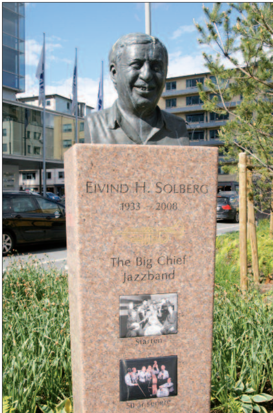
Statue i Sørkedalsveien 2

Eivind selv var aktiv i klubbvirksomhet (Big Chief 1952–64, Kunstnerkroa 1957–59, Metropol Jazzsenter 1959–65 og Down Town 1965–86), i jazztidsskrift og NM i amatørjazz. Han er utnevnt til æresborger av New Orleans, og i 2003 mottok han «Ildsjelprisen» fra Selskapet for Norges Vel. Ikke rart han fortjener en statue på Majorstua: