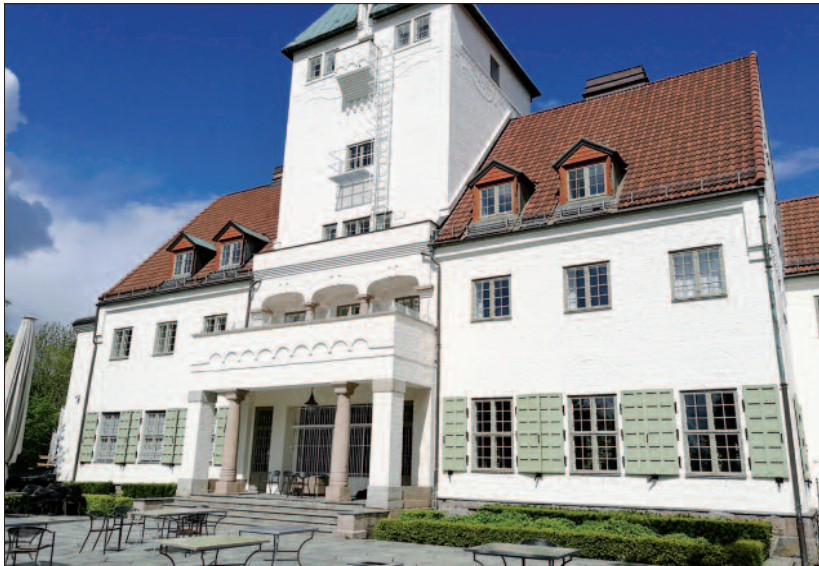
Villa Grande på Bygdøy, der Vidkun Quisling residerte fra høsten 1941 – og døpte om stedet til det mytologiske «Gimle».

Den 1. februar ble Quisling innsatt som «ministerpresident». I protest mot dette sprengte Osvald-gruppen to bomber påfølgende natt, en i restauranten til Vestbanestasjonen og en på Østbanen. Så fulgte noen rolige måneder, med et vitalt