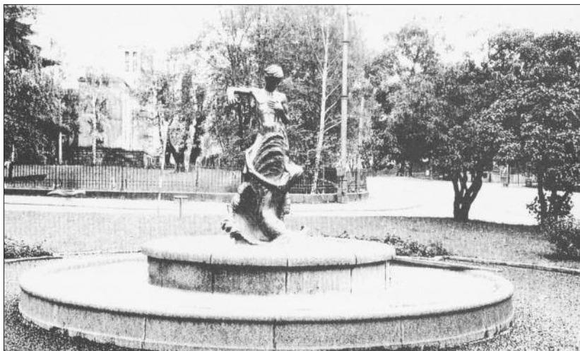
Et glimt av Skillebekk i mer landlig idyll enn det er i dag. Bak skimter vi det gamle huset som lå der før Rikstrygdeverket kom med sine mange betongetasjer.