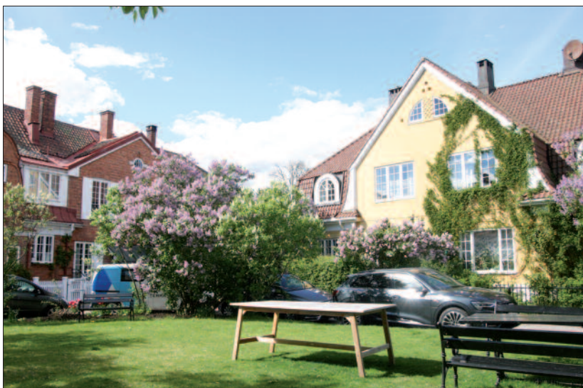
Fra «Rundingen» i Det engelske kvarter, Halvdan Svartes gate 8–30. Arkitekt: Harald Hals.

I England var Harald Hals blitt inspirert av de moderne engelske hagebyer. Han foreslo å anlegge en husgruppe mellom gaten og bakken ned mot Frognerbekken, og med en stikkvei fra Halvdan Svartes gate inn til en rund plass midt i grenda. Alle