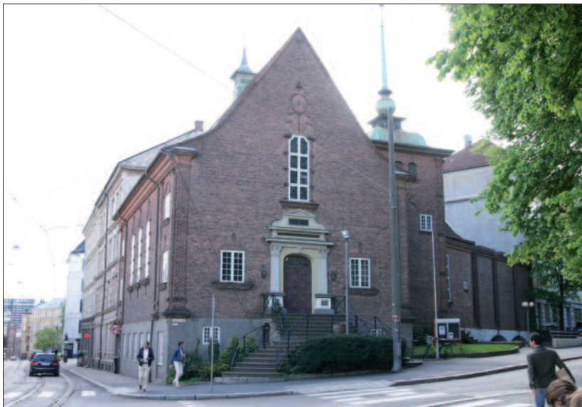
Vestre Evangelisk Lutherske Frikirke, Pilestredet 69.

Et mer beskjedent, men utsøkt anlegg er Vestre Evangelisk Lutherske Frikirke på hjørnet av Pilestredet og Josefines gate (adresse Pilestredet 69), oppført 1919–20, arkitekter: Harald Aars og Lorentz Ree. Fasadene er utført i håndbanket fuget tegl. Uten hjelp av «nips» er teglen murt med detaljerte gesimser og andre detaljer. Særlig vakkert er partiet fra hovedtrappen og opp til hovedinngangen. Utførelsen tok arkitekt Ree med seg til Vigelandmuseet. Der er stilen mer renskåret – vi er der i 1920-