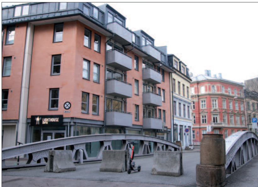
«Brua» i Ruseløkkveien.

En dag skal vi dævvve. En dag er det slutt. Men fram til den dagen, så holder vi ut. For om greiene ikke bestandig er topp, så har vi no`n venner som støtter oss opp, i vårt nabolag, i vårt nabolag, i vårt nabolag.