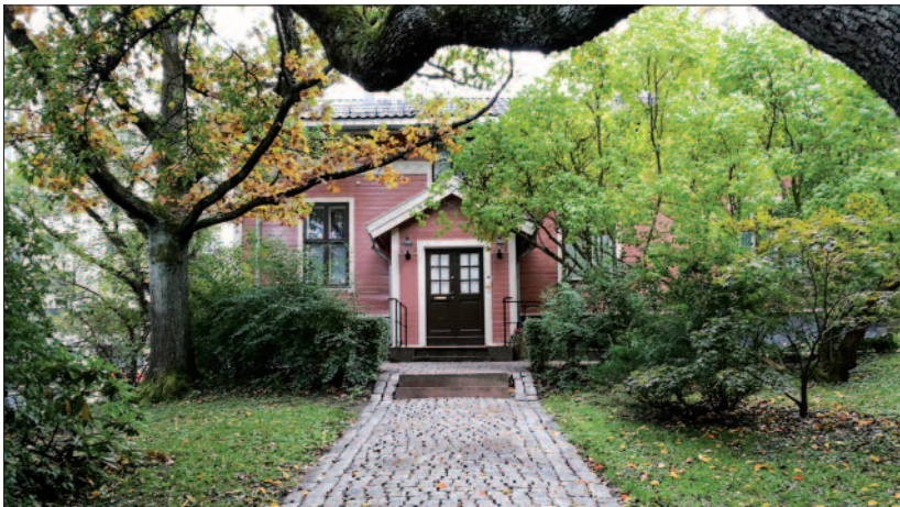
Vårvandringen starter i Slottsparken, utenfor Grotten, Wergelandsveien 2–4.

Som en fortsettelse av høstens vandring fra Rosenborg til Grotten, fullfører vi turen på vår østre Frogner-rygg med den sydøstre delen, fra Grotten til Tjuvholmen. Oppmøte i Slottsparken, utenfor Grotten, Wergelandsveien 2–4, tirsdag 9. juni kl. 18.00 . Antrekk: gode sko, men det er ingen lang tur – omtrent halvannen kilometer.