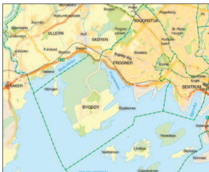
Kart over vår bydel