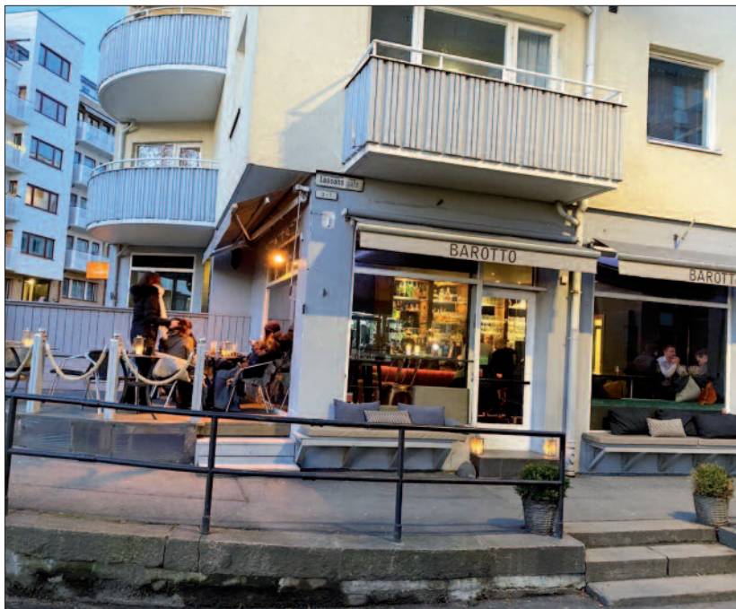
Parkveien 80 i dag.

Jeg bare nevner det, som ett av flere eksempler på at bydelen vår er mer mangfoldig enn det som framkom i høstens EXIT.