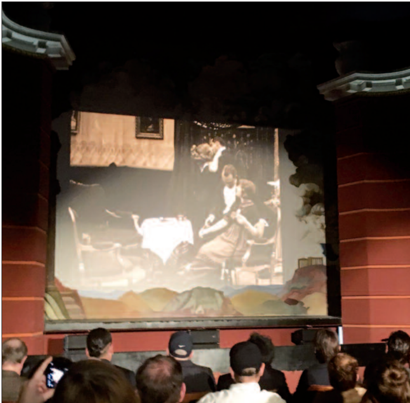
Stemmingsfullt i Frogner kino.

Det store spørsmålet nå, er om Frogner kino vil greie seg økonomisk. Det avhenger av publikum – med andre ord oss. Vi bør kjenne vår besøkelsestid.