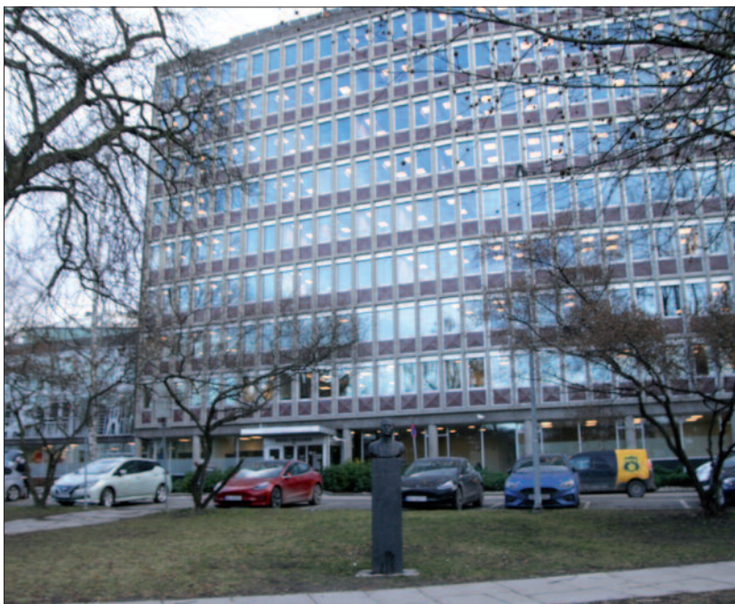
Olaf Bulls byste er på plass i parken. Bak til venstre finner vi sidebygningen med Arne E. Holms voluminøse aluminiumsgitter.

I mange år etter at bygget var ferdig, ble første etasje leid ut til virksomheter til nytte for lokalsamfunnet. Her var postkontor, bank og apotek. Disse er for lengst borte, slik andre servicetilbud og spesialforretninger også er. Fram til midten av syttiårene var Skillebekk mer eller mindre selvforsynt, det var flere dagligvareforretninger, slakter, fiskebutikk, manufaktur, bibliotekbuss en gang i uken, spiseforretning og annen nyttig virksomhet. Alt dette er nå borte. Sic transit gloria mundi!