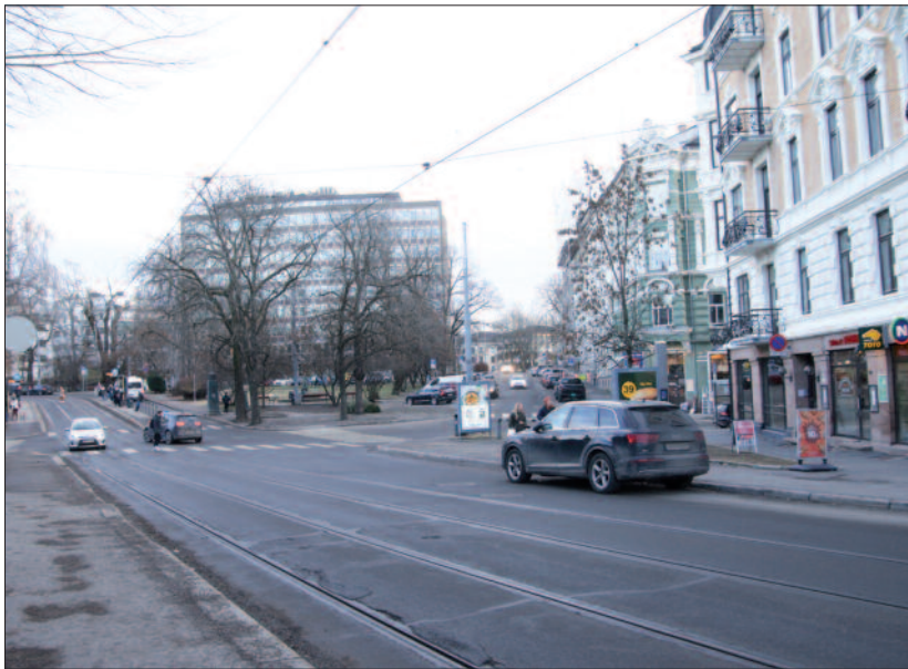
Bydelens «rådhus» ruver på Skillebekk.

Gamle europeiske byer, der kultur var høyt verdsatt, hadde sine rådhus, som, ved siden av kirken, var de dominerende i bybildet. Det er, etter mitt skjønn, en forflatning av byene når de kommersielle bygningene konkurrerer seg imellom om å være