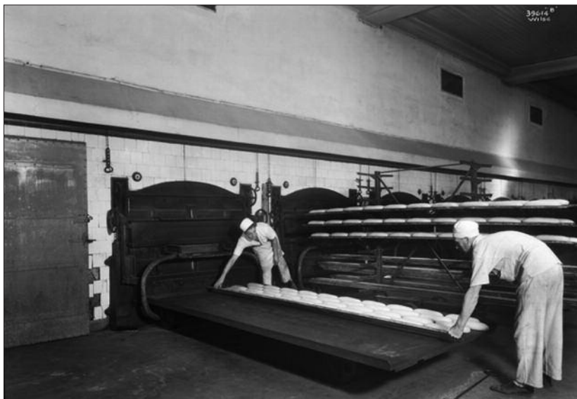
Interiør fra Kristiania Brødfabrik, 1932.

Men initiativtakerne ville også drive det som på moderne norsk heter eiendomsutvikling. Fabrikken skaffet seg lokaler hos Nora bryggeri i Pilestredet 75 C – i det vi nå kaller Norabakken. Her startet gründerne også selskapet A/S