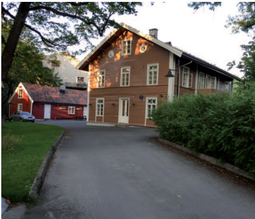
Lassonløkken, 27.9.2019.