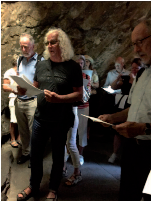
Allsang i Grotten.