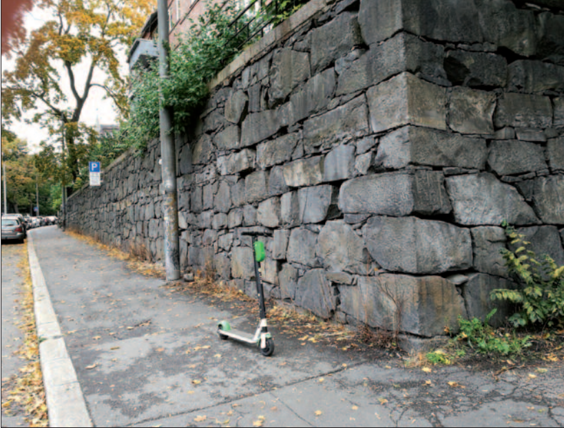
En «svenskemur» fra 1808–09 i Drammensveien 44–46.

I løpet av 1809 hadde alle svenske krigsfanger forlatt Norge. 10. desember 1809 ble det i Jönköping erklært fred mellom Norge og Sverige. Danmark fortsatte å være i krig mot Sverige, men i den norske delen av kongeriket ble det nå ganske rolig. Rolig nok til at man for eksempel kunne grunnlegge et norsk universitet i 1811. Og Oslo Byes Vel ble etablert samme år.