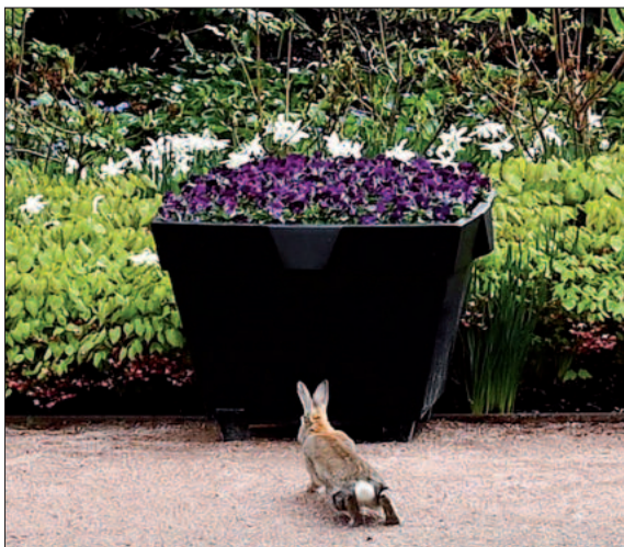
Hare i Slottsparken.