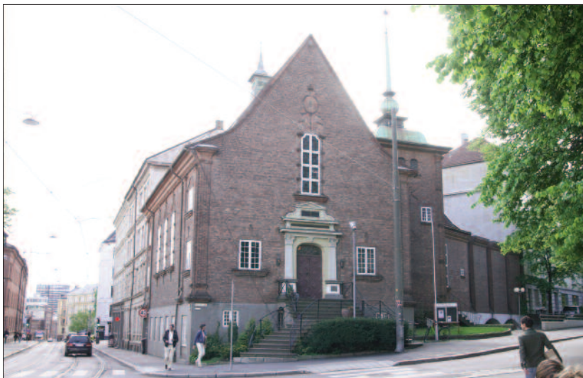
Svaret på spørsmål 13.