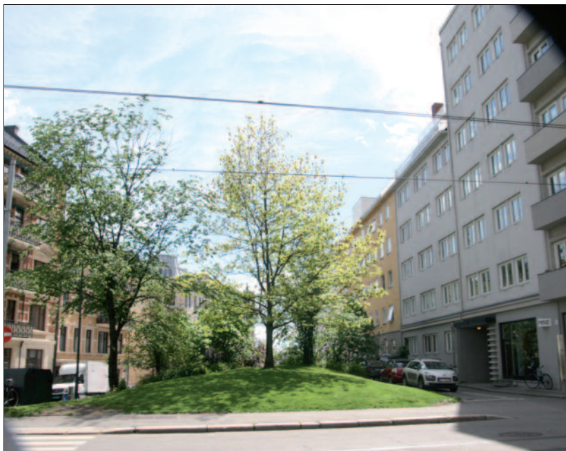
Frederik Stangs gate kiler seg inn i Skillebekk ved Drammensveien 70 C og Bjørn Farmanns gate 14–16.

av Det Engelske Kvarter (Halvdan Svartes gate 8–30, 1911–14) ble han med på å utforme Halvdan Svartes og Ottar Birtings gater til mykt svingende ferdselsårer.