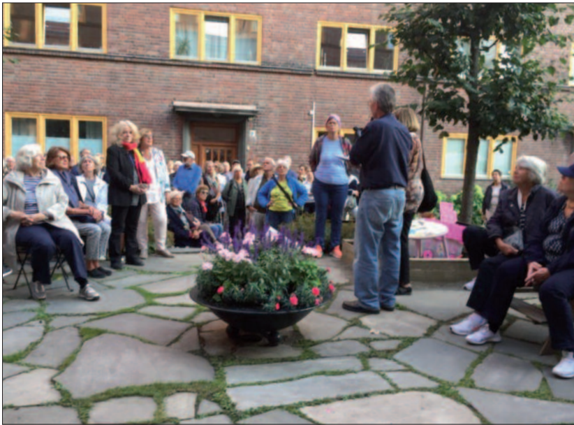
Historielaget besøkte Lille Uranienborg i august 2018.

I dag, i 2020, har også kommunalminister Nikolai Astrup, Høyre, vært seg sitt ansvar bevisst.