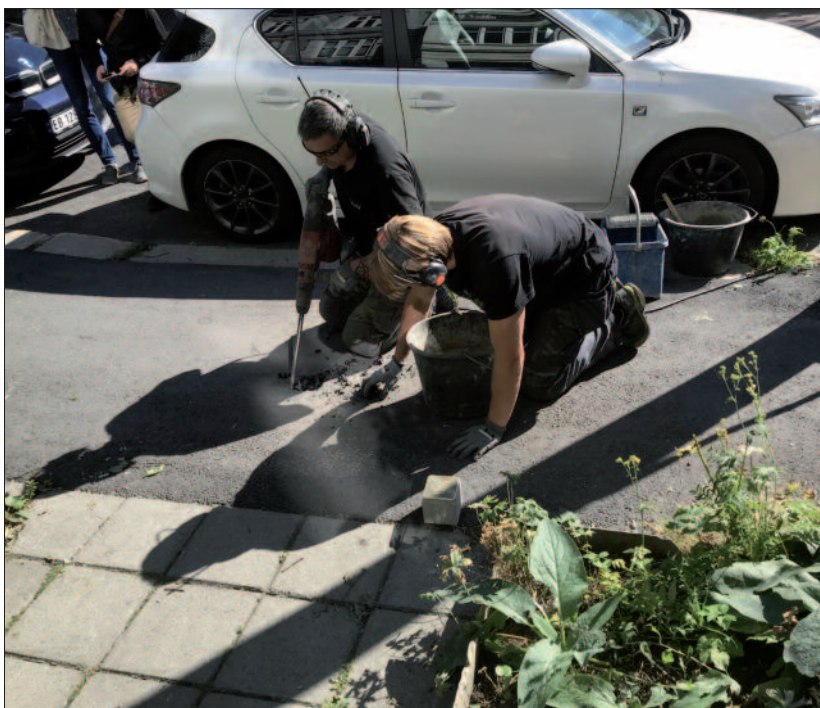
Snublestein legges ned utenfor Heinz Michels bopel i Eilert Sundts gate 20.