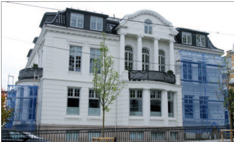
Drammensveien 41, 1908–09, arkitekt Ole Sverre, tildelt Sundts premie.