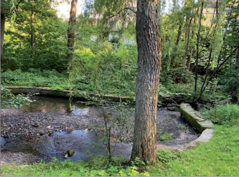
Frognerbakkens nedre del er både vill og tam, fri og bevokst, vakker og pittoresk.

ene, som ble oppført i begynnelsen av 1900-tallet. Madserud var en plass under Skøyen hovedgård, et herskabelig løkkeanlegg anlagt 1873–90. Madserudhjemmet kom i 1988.