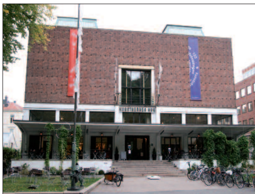
Kunstnernes Hus, 1930, arkitektene Blakstad & Munthe-Kaas, med pris fra Houens Fond.

Menighetsfakultetet , Gydas vei 4, 1972, arkitekt Harald Hille.