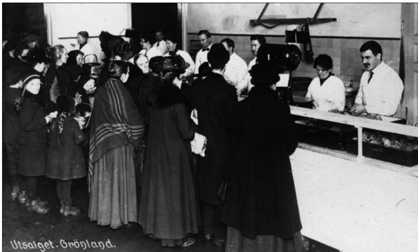
Spanskesyken spredte seg via åpne møtesteder, som i butikker, her i det kommunale matutsalget på Grønland.

Karantene og isolasjon har vært både velprøvde og vellykkede tiltak mot epidemier og pandemier i Europa i hundrevis av år, og i mangel av effektive vaksiner og medikamenter er dette fortsatt de viktigste tiltakene for å hindre smittespredning. Også under Spanskesyken ble skoler, teatre, kinoer og forsamlingslokaler stengt de fleste steder i landet – men ikke her i byen. Sunnhetskommisjonen i Kristiania mente nemlig at stenging av lokaler ikke ville ha noen som helst betydning i en storby. Smitten sprer seg over alt hvor mennesker møtes, mente de, enten det var i butikken,