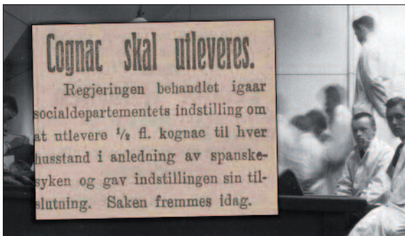
For hundre år siden var legene enige: Cognac hjelper...