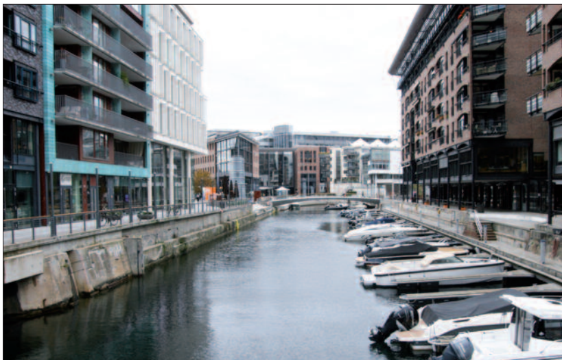
«Tørrdokka» i dag – ikke så tørr: Bolette brygge til venstre, Stranden 81–91 til høyre.