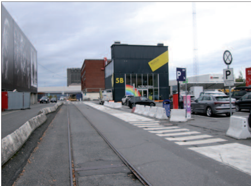
Filipstadbrygga i dag. Her blir det boliger og opplevelser. Foto september 2020: Bjørn Stendahl.