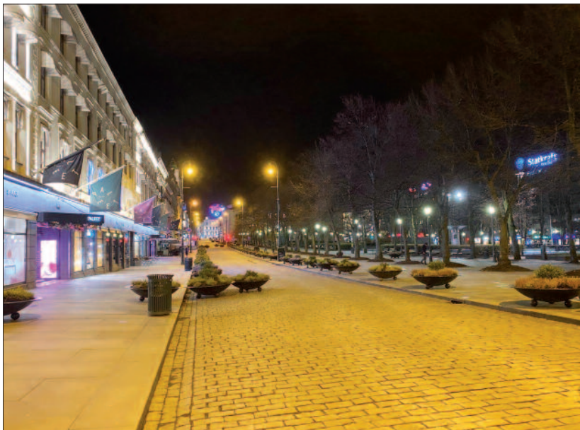
Det er stille i byen i disse korona-tider.

Det nye koronaviruset – som på fagspråket heter SARS-CoV-2 – skal først ha blitt brakt til Oslo med folk som kom hjem fra skiferie i Ischgl i Østerrike. Der hadde after-ski-kneipene vist seg som effektiv spredningsmark for smittestoffet. Det var i slutten av februar. Men til tross for at pandemien allerede da hadde begynt å gjøre seg faretruende gjeldende i flere europeiske land, la myndighetene i alpebyen løkk på saken så lenge det lot seg gjøre, og unnlot å sette i verk smitteverntiltak. Av hensyn til den lokale turistindustrien, ville de ikke bidra til at stedet fikk dårlig rykte. Denne strategien må sies å ha vært temmelig kontraproduktiv, for den førte til at Ischgl på kort tid ble langt bedre kjent som episenter enn byen noensinne hadde vært som ferie-